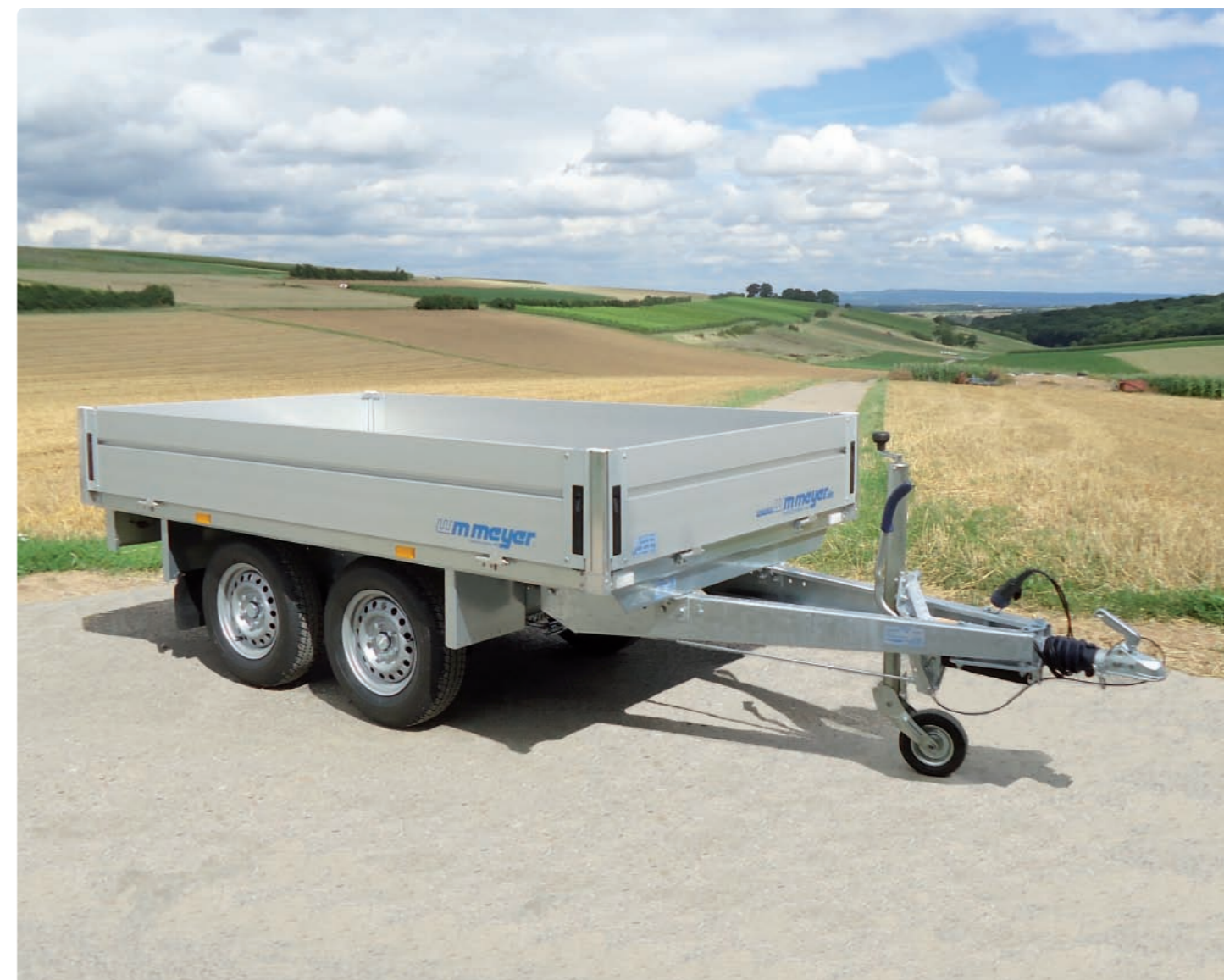
HLN 2026/151 Alubordwände eloxiert (Stärke: 25 mm, Höhe: 330 mm), Zubehör: Stützrad verstärkt (klappbar, mittig) HLN 2026/151 Ridelles en alu anodisé (épaisseur : 25 mm, hauteur : 330 mm), option : roue jockey renforcée (automatique, au milieu du timon) HLN 2026/151 Aluminium side panels (width: 25 mm, height: 330 mm), optional: reinforced jockey wheel (automatic, in the middle of the drawbar)