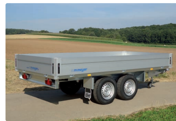
HLN 2526/170 Stützrad verstärkt (klappbar, mittig) HLN 2526/170 Roue jockey renforcée (automatique, au milieu) HLN 2526/170 Reinforced jockey wheel (automatic, in the middle of the drawbar)