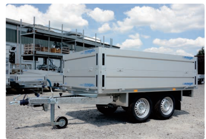
HLN 2026/151 Zubehör: Bordwanderhöhung HLN 2026/151 Option : ridelles supplémentaires HLN 2026/151 Optional: additional side panels