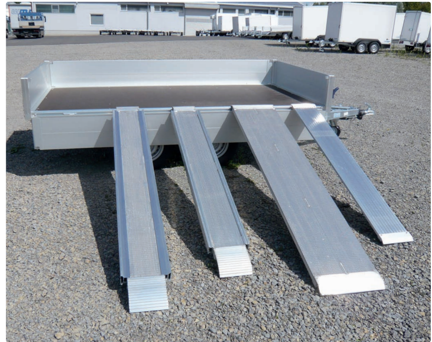
Solide Verarbeitung und extreme Langlebigkeit, hier: AM 80 27/27/22, AM 80 25/27/25, AL 40 25/44/0,50 Sonder, AL 21 25/51/0,48 Finition impeccable et longévité importante, ici : AM 80 27/27/22, AM 80 25/27/25, AL 40 25/44/0,50 Spéciales, AL 21 25/51/0,48 Excellent workmanship and formidable longevity, here: AM 80 27/27/22, AM 80 25/27/25, AL 40 25/44/0,50 Special, AL 21 25/51/0,48