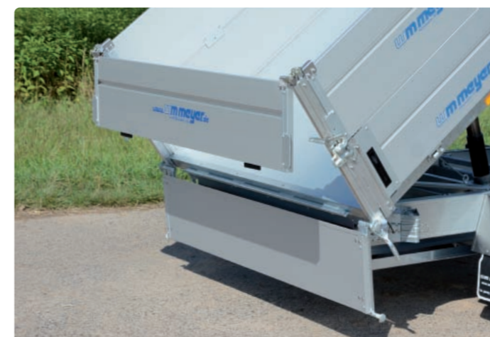
Zubehör: Alubordwanderhöhung abnehmbar; untere Heckwand links: aufgeklappt; untere Heckwand rechts: aufgeschwenkt Options : ridelles supplémentaires en aluminium qui peuvent être enlevées ; illustration des 2 manières d'ouvrir la ridelle arrière basse Optional extra: additional aluminium side panels which can be taken off; illustration of the 2 ways of opening the lower rear panel