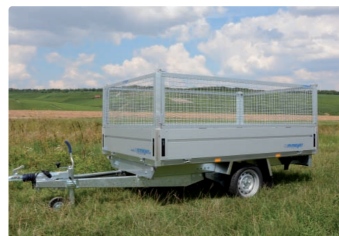
HLC 1326/170 Zubehör: Stahlgitteraufsatz HLC 1326/170 Option : rehausse grillagée en acier galvanisé HLC 1326/170 Optional extra: steel mesh extension sides