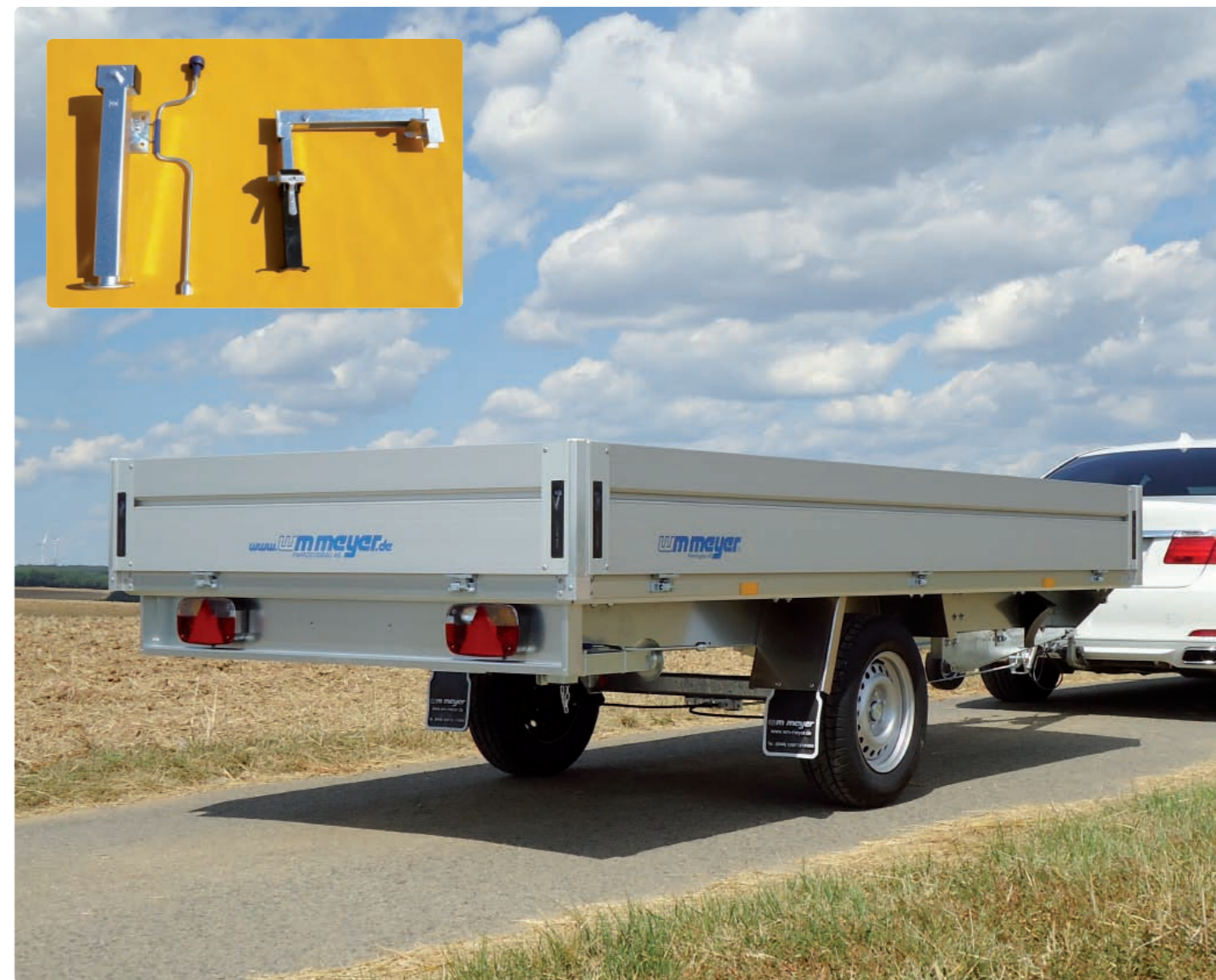
HLC 1336/170 Zubehör: Klappkurbelstützen; kleines Bild: Klappkurbelstütze (links), Automatikstütze (rechts) HLC 1336/170 Options : béquilles à relever ; petite image : béquille à relever avec manivelle (à gauche), béquille automatique (à droite) HLC 1336/170 Optional extras: prop stands, with crank; small picture: prop stand to be folded away, with crank (left), automatic prop stand (right)