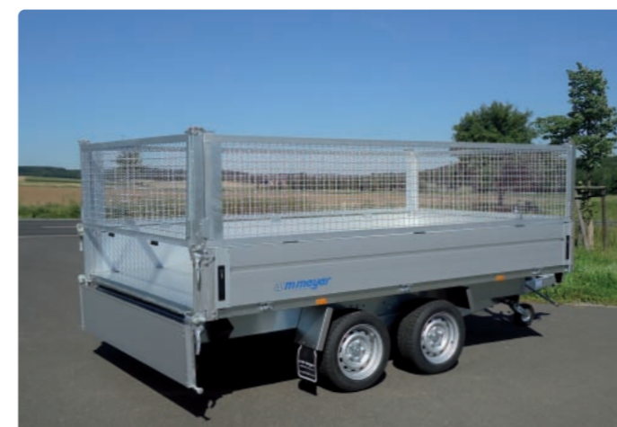
HKCR 2731/186 Zubehör: E-Pumpe, Stahlgitteraufsatz HKCR 2731/186 Options : pompe électrique, rehausse grillagée HKCR 2731/186 Optional extras: electric pump, mesh extension sides