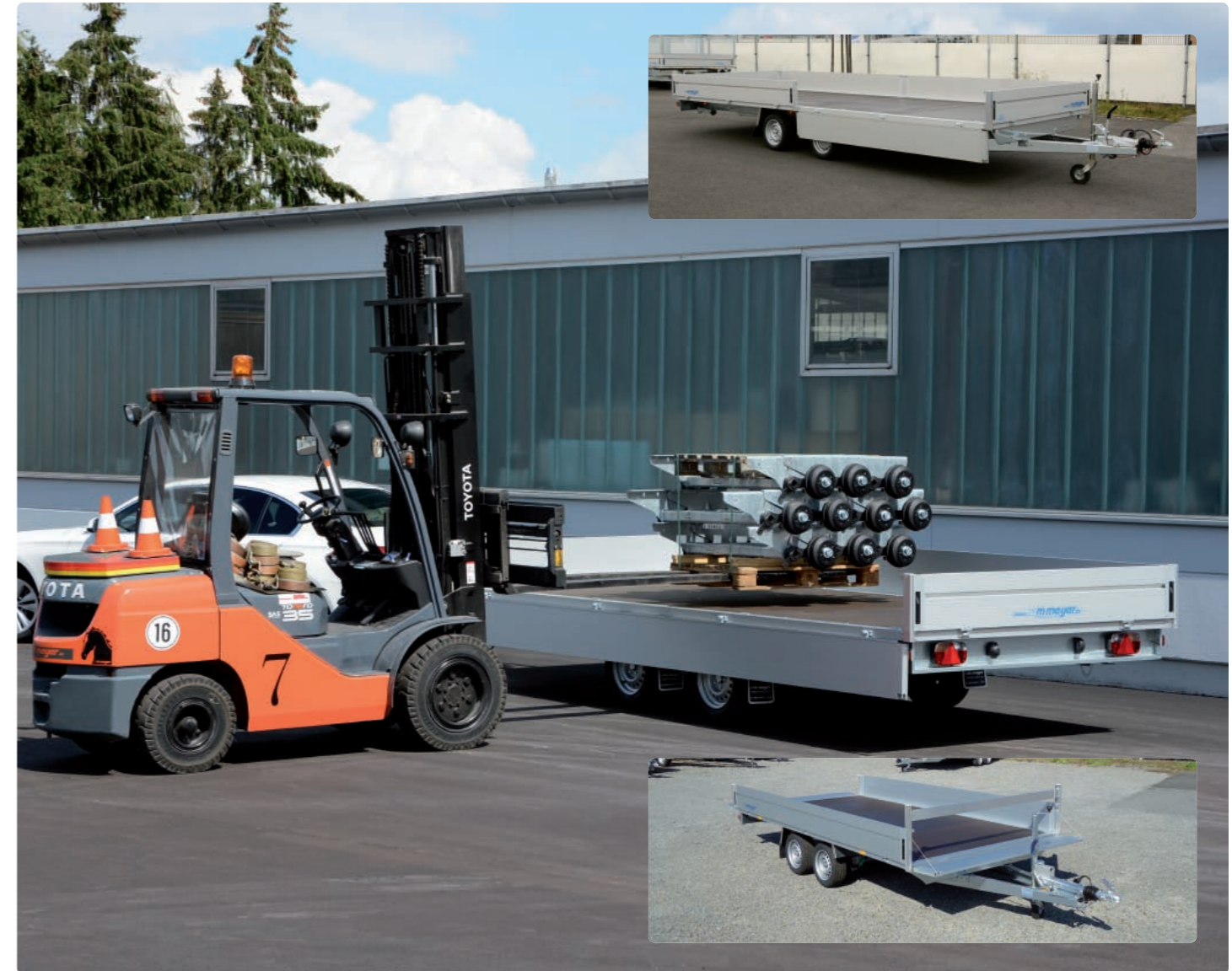
HLC 2751/210 4 Seiten klapp- und aushängbar; Bild oben: HLC 3560/210 mit Mittelrungen; Bild unten: HLC 3541/210 Zubehör: H-Gestell u.a. HLC 2751/210 Toutes les ridelles ouvrables ; photo en haut : HLC 3560/210 avec ranchers centraux ; photo en bas : HLC 3541/210 Option : porte-échelle, etc. HLC 2751/210 All side panels can be opened and removed; upper picture: HLC 3560/210 with centre posts; lower picture: HLC 3541/210 Option: ladder rack, etc.