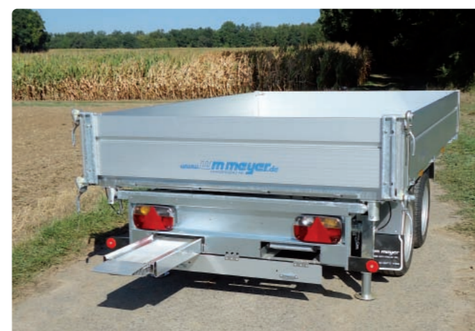
HKC 2726/170 Zubehör: Auffahrschienen HKC 2726/170 Option : rampes HKC 2726/170 Optional extra: loading ramps