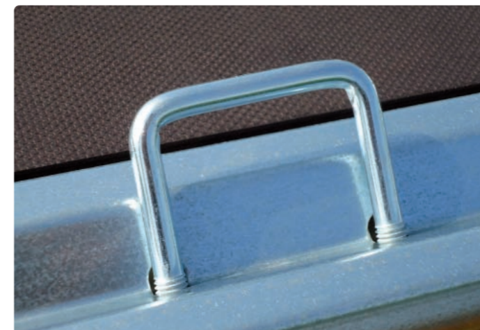
Zurrbügel versenkt bis 4.605 mm Innenlänge Crochet d'arrimage intégré au plancher jusqu'à 4.605 mm (longueur intér.) Tie ring integrated into platform up to 4,605 mm (internal length)