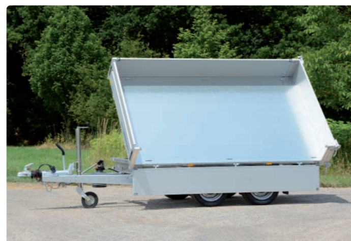
HKC 2726/155 Dreiseitenkipper HKC 2726/155 Tri-benne HKC 2726/155 Three-side tipper

Remove the fastening bolts on the side of the trailer where the bridge will be elevated (front, right, left). If the fastening bolts are not removed and you try to elevate the bridge, chassis and bridge will be gravely damaged.