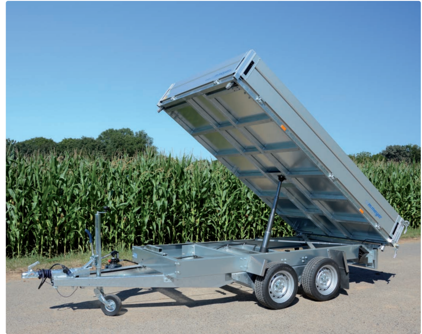
HKCR 2731/186 13"-Bereifung, Handpumpe, geschraubtes Chassis, Kippbrücke geschweißt HKCR 2731/186 Pneus 13", pompe manuelle, châssis boulonné, pont soudé HKCR 2731/186 13" tyres, manual pump, bolted chassis, welded tipping bridge