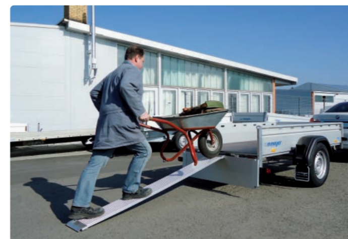
HKCR 2731/186 Zubehör: E-Pumpe, Stahlgitteraufsatz HKCR 2731/186 Options : pompe électrique, rehausse grillagée HKCR 2731/186 Optional extras: electric pump, mesh extension sides