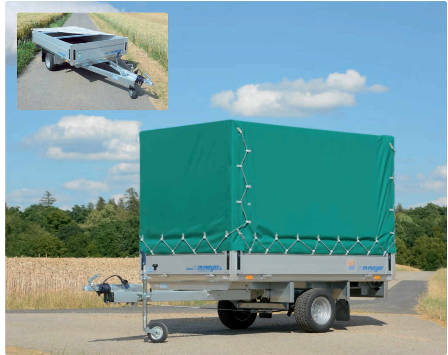
HLN 1323/141 Zubehör: Plane und Aluminiumspriegel; kleines Bild: Zubehör: Flachplane HLN 1323/141 Options : bâche et ossature en alu ; petite image : bâche basse HLN 1323/141 Optional: canvas top, aluminium support; small picture: low canvas top