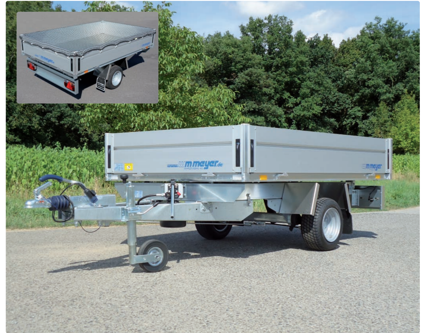
HLNK 1523/141 10"-Bereifung, geschraubtes Chassis, geschweißte Brücke, Metallboden; kleines Bild: Ladungssicherungsnetz HLNK 1523/141 Pneus 10", châssis boulonné, plateau soudé massif, plancher en métal ; petite image : filet d'arrimage HLNK 1523/141 10" wheels, bolted chassis, solid welded platform with metal sheet on top; small picture: trailer net