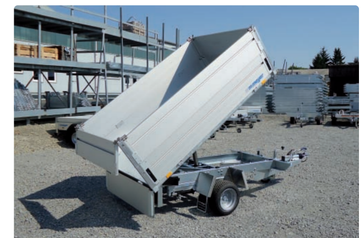
HLNK 1323/141 Zubehör: Stütze, Bordwanderhöhung HLNK 1323/141 Options : béquilles, ridelles supplémentaires HLNK 1323/141 Optional extras: prop stands, additional panels