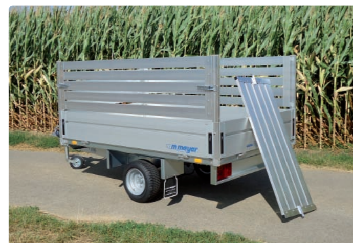
HLN 1323/141 Zubehör: Alulaubaufsatz HLN 1323/141 Option : rehausse en alu HLN 1323/141 Optional: aluminium extension