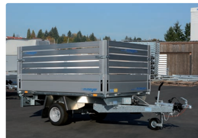
Zubehör: Alulaubaufsatz Option : rehausse en alu Optional extra: aluminium extension sides