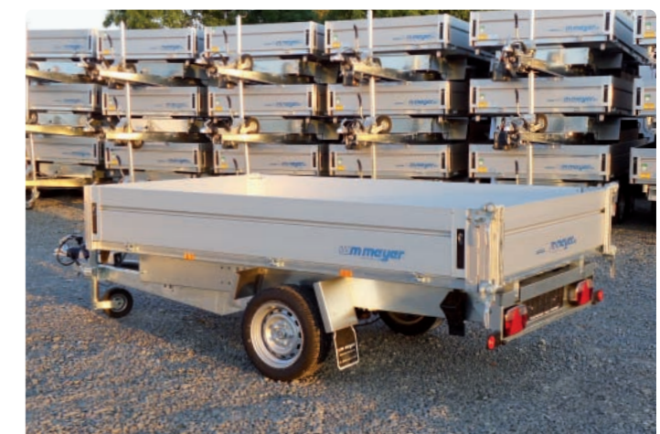
HKCR 1527/155 Heckwand klapp-, schwenk- und aushängbar HKCR 1527/155 Ridelle arrière enlevable, basculante dans les 2 sens HKCR 1527/155 Swivelling and removable rear panel