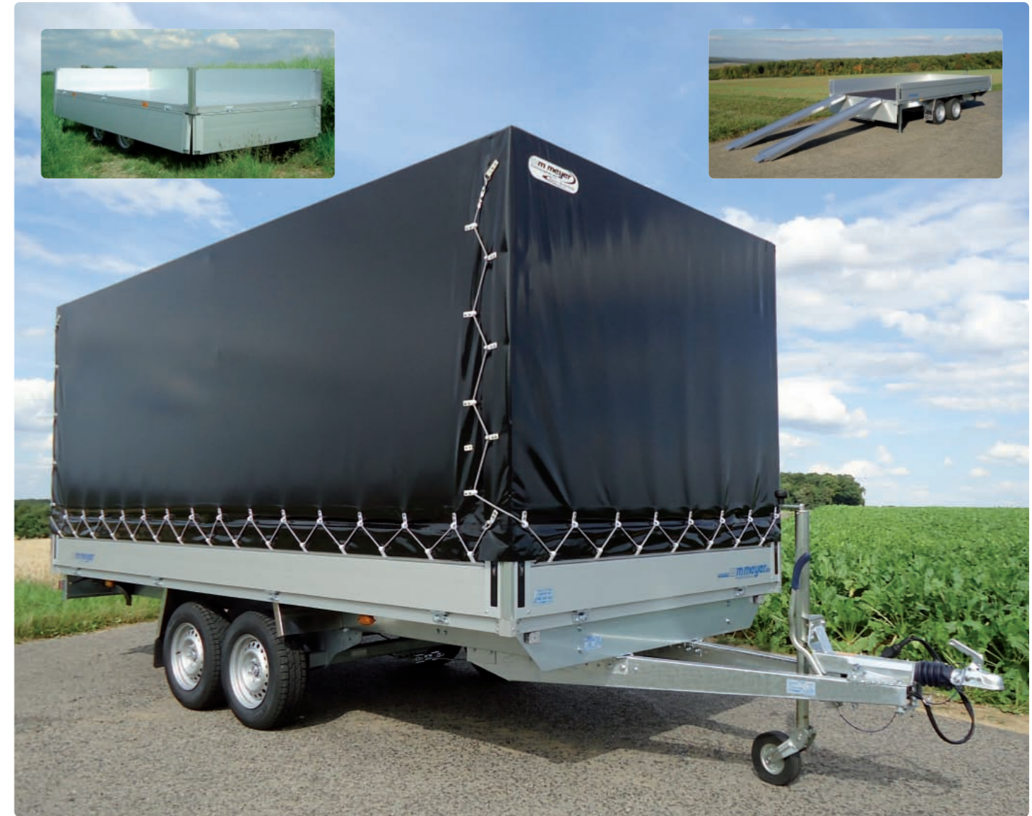
HLC 2746/210 Zubehör: Plane, Spriegel; Bild links: HLC 2746/186 Zubehör: Aluprofilboden; Bild rechts: HLC 2741/186 Zub.: Auflaufschienen, Klappkurbelstützen HLC 2746/210 Options : bâche, ossature ; image gauche : HLC 2746/186 Options : plancher en alu ; image droite : HLC 2741/186 Options : rampes, béquilles HLC 2746/210 Optional: canvas top, support; left picture: HLC 2746/186 Optional: aluminium profile platform; right picture: HLC 2741/186 Opt.: skids, prop stands