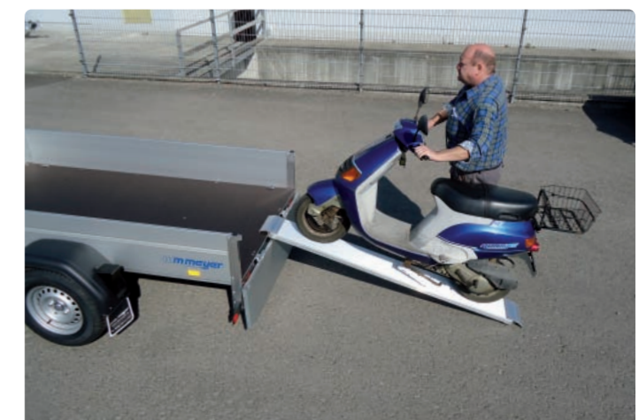
HKCR 2731/186 Zubehör: E-Pumpe, Stahlgitteraufsatz HKCR 2731/186 Options : pompe électrique, rehausse grillagée HKCR 2731/186 Optional extras: electric pump, mesh extension sides