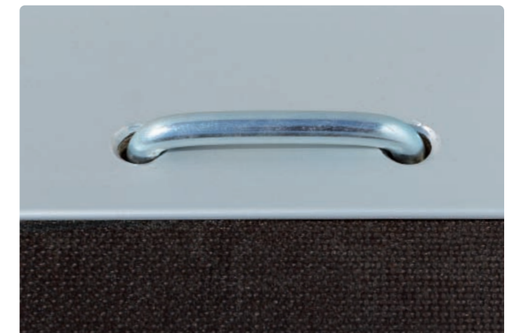
Zurrbügel aufgesetzt ab 4.605 mm Innenlänge Crochet d'arrimage sur plancher à partir de 4.605 mm (longueur intérieure) Tie ring on platform beginning with 4,605 mm (internal length)