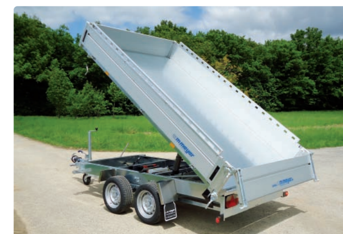
HKC 2731/186 Zubehör: Reling u.a. HKC 2731/186 Options : main-courante, etc. HKC 2731/186 Optional extras: top rail, etc.