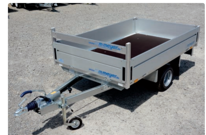
HLN 1323/141 Zubehör: H-Gestell HLN 1323/141 Option : porte-échelle HLN 1323/141 Optional: ladder rack