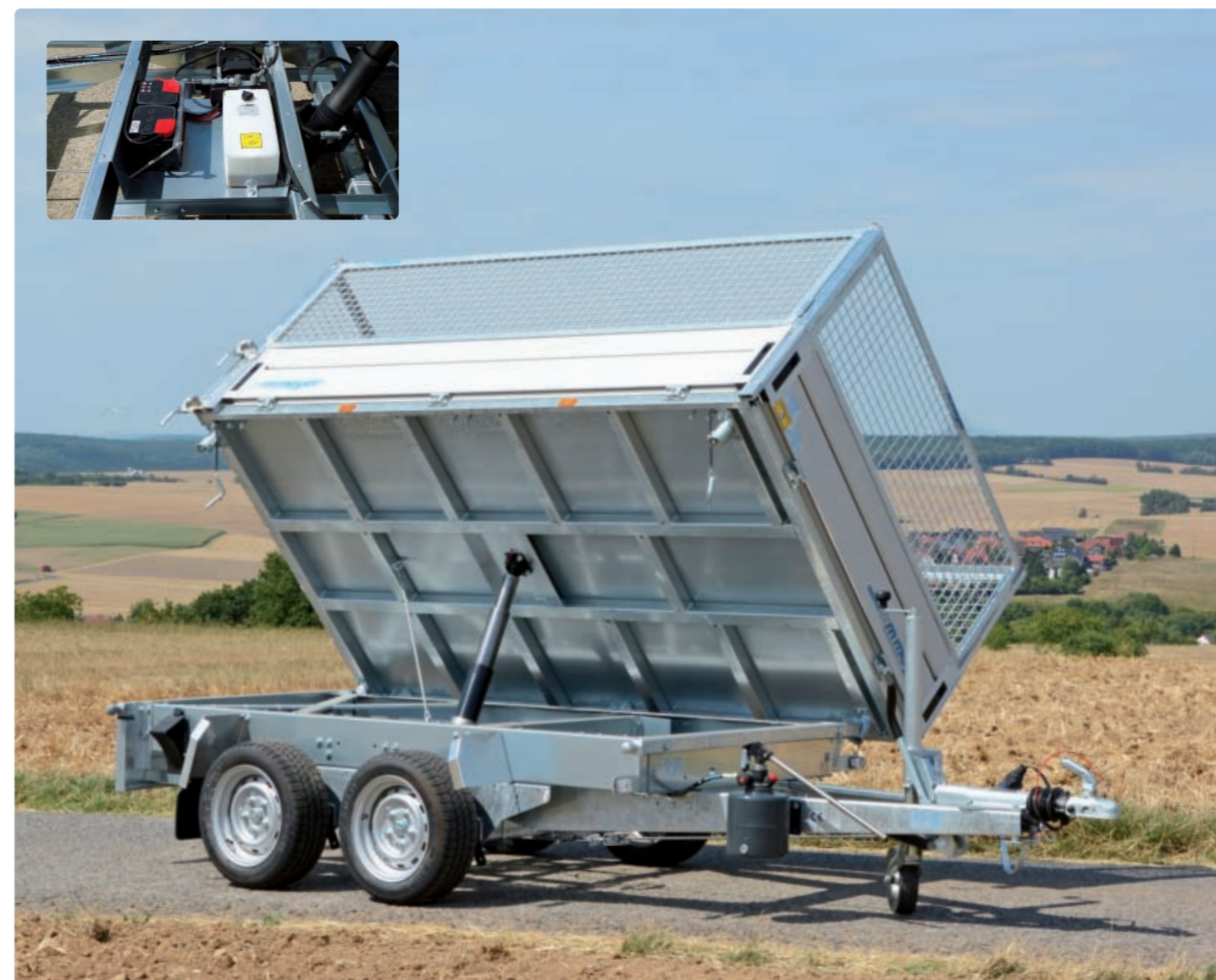
HKC 2726/155 Chassis geschraubt, Kippbrücke geschweißt, Handpumpe, Zubehör: Stahlgitteraufsatz; kleines Bild: Elektropumpe mit Handpumpe und Batterie HKC 2726/155 Châssis boulonné, pont soudé, pompe hydraulique manuelle, option : rehausse grillagée ; petite image : pompe électrique / manuelle et batterie HKC 2726/155 Bolted chassis, welded tipping bridge, manual hydraulic pump, optional: steel mesh extension; small picture: electric / manual pump and battery