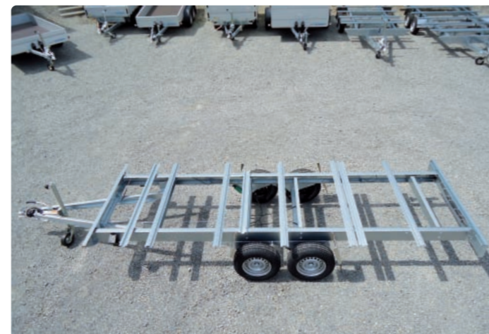
HLC 2751/186 Chassis von oben: geschraubte Konstruktion HLC 2751/186 Châssis vu d'en haut : construction boulonnée HLC 2751/186 Chassis from above: bolted construction