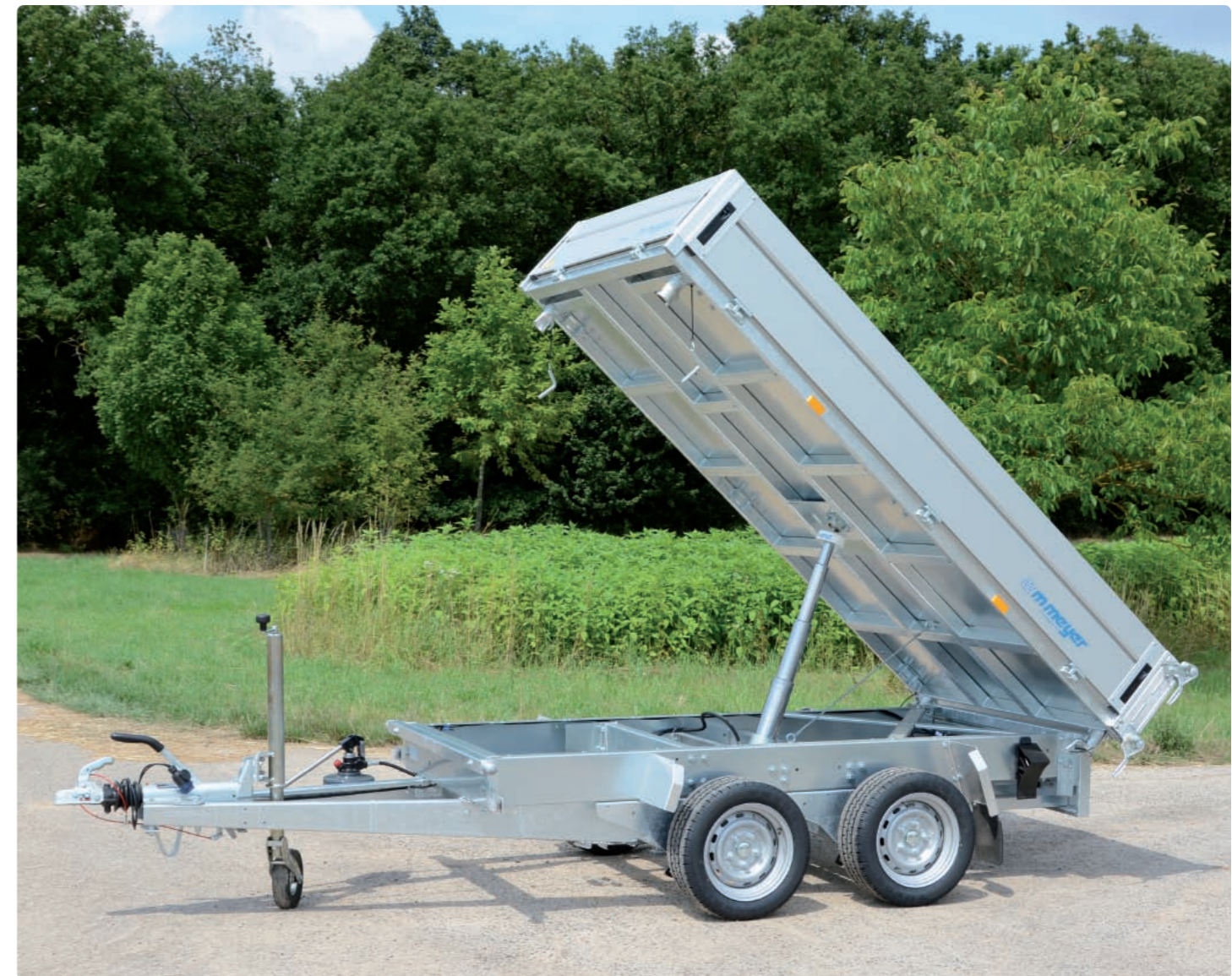
HKC 2726/155 Chassis geschraubt, Auffahrschienenhalterung (mit klappbaren Verschlussblechen), Kippbrücke geschweißt, Metallboden HKC 2726/155 Châssis boulonné, supports de rampes (avec clapets rabattables), pont soudé, plancher en métal HKC 2726/155 Bolted chassis, 2 storage shafts for skids (with flaps), welded tipping bridge, metal platform