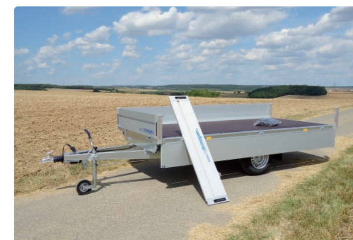
Alle Bordwände abnehmbar, Zubehör: Ladungssicherungsnetz (verpackt) Toutes les ridelles peuvent être enlevées, option : filet d'arrimage (emballé) All side panels can be removed, optional extra: trailer net (in packaging)